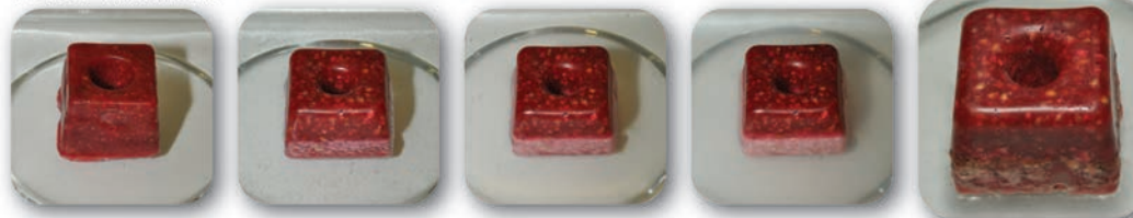
PelGar wax block

Les propriétés des blocs de cire PelGar se conservent parfaitement, même lorsqu'ils sont immergés dans l'eau. La formulation du bloc extrudé est affectée presque immédiatement, la couleur est lavée en quelques heures et l'apparition de bactéries / moisissures peut être observée dans les 24 heures. Lorsque les blocs PelGar sont secs, leur qualité est toujours excellente, tandis que les blocs extrudés sont acidifiés, en miettes et ne peuvent plus être consommés par les rongeurs.